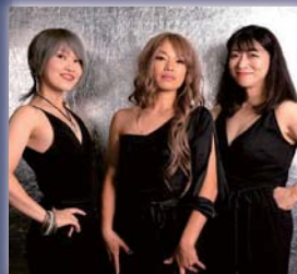
【うた】マンハッタンレイン