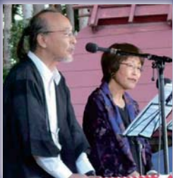
【語り】小林へろ 【語り】樋口幸子 【クラシックギター】植木和輝