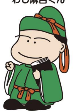
No.4 基本ポーズ 4