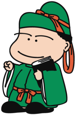
No.1 基本ポーズ 1