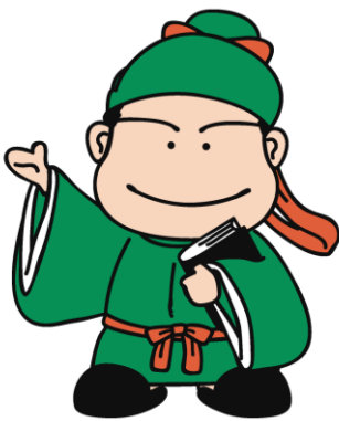
No.5 基本ポーズ 5