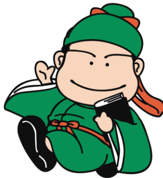
No.6 基本ポーズ 6