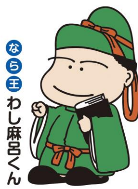
No.3 基本ポーズ 3