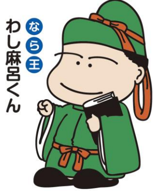
No.2 基本ポーズ 2