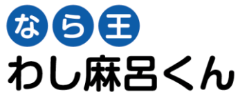
No.17 ロゴ (横)