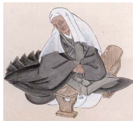
貞心尼肖像画(柏崎市立図書館所蔵)

貞心尼の遺墨とともに関連資料を展示し、柏崎の人びととの交流や、現在まで貞心尼の事績が語り継がれる礎を築いた先人たちの功績を通して、貞心尼の魅力を伝えます。長く門外不出とされてきた貞心尼の歌集「もしほぐさ」(極楽寺所蔵)を実物展示します。